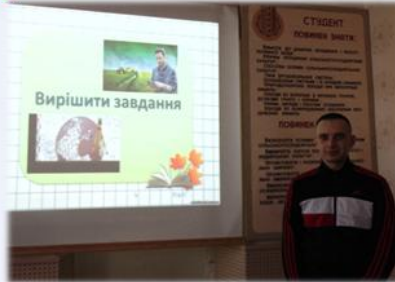
Рішення ситуаційних задач